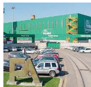
A Lonato. Il sito della Feralpi

■ Feralpi Group chiude un bilancio 2021 da record e pur in un mercato pieno di incertezze annuncia un piano industriale da oltre 400 milioni. A PAGINA 27