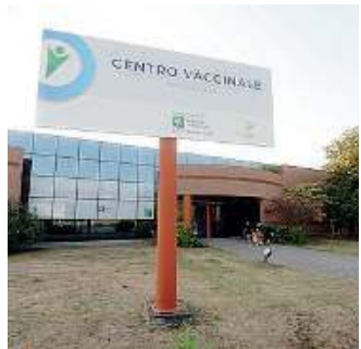
Una sede. L'hub di Poncarale

Gli hub vaccinali per ora restano sei «Ma pronti ad ampliare gli orari»