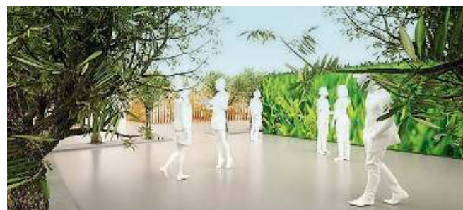
Brescia 2050. Un patto per la sostenibilità e una città più verde

pitale della sostenibilità. All'appuntamento aperto al pubblico, che si terrà al Brixia Forum dal 2 al 4 ottobre, hanno aderito un centinaio di realtà, fra aziende, istituzioni e Università. Una settantina i convegni in programma, con oltre 270 relatori fra docenti, manager, rappresentanti di istituzioni, attori e scrittori. A PAGINA 8 E 9