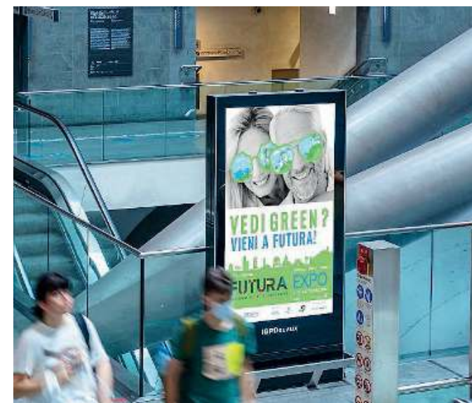
Pubblicità. La locandina di Futura Expo esposta in una stazione metro