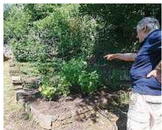
Verde. I danni arrecati all'orto

Danneggiato un orto in zona Panoramica Allarme dei residenti «Ora abbiamo paura»