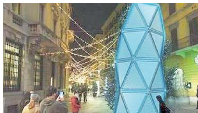
Nel cuore del centro. Eco2Air Tower sverterà per sette metri

Non solo. Eco2Air Tower entrerà virtualmente anche al Brixia Forum, grazie ad un olo-