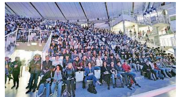
In migliaia. Una passata edizione della Smart Future Academy

«Futura un progetto entusiasmante - è l'elogio dell'assessore regionale Alessandro