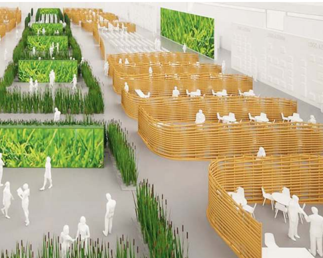
Ecologica e modulare. Una ricostruzione grafica dell'allestimento ideato dall'architetto Laezza